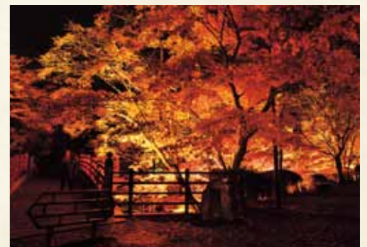
弥彦公園もみじ谷