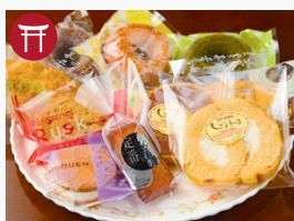
パレドールワタナベ