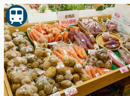
農産物直売所やひこ